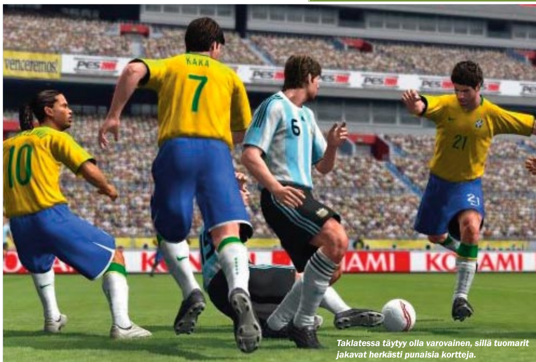
Taklatessa täytyy olla varovainen, sillä tuomarit jakavat herkästi punaisia kortteja.

Erinomainen idea toimii vain osittain, sillä tekoilyn typeryys korostuu pelaajan ohjatessa vain yhtä äijää. Pelikaverit malttavat rakentaa peliä vain hetkittäin, turhan usein pallollinen ukko puskee suo-