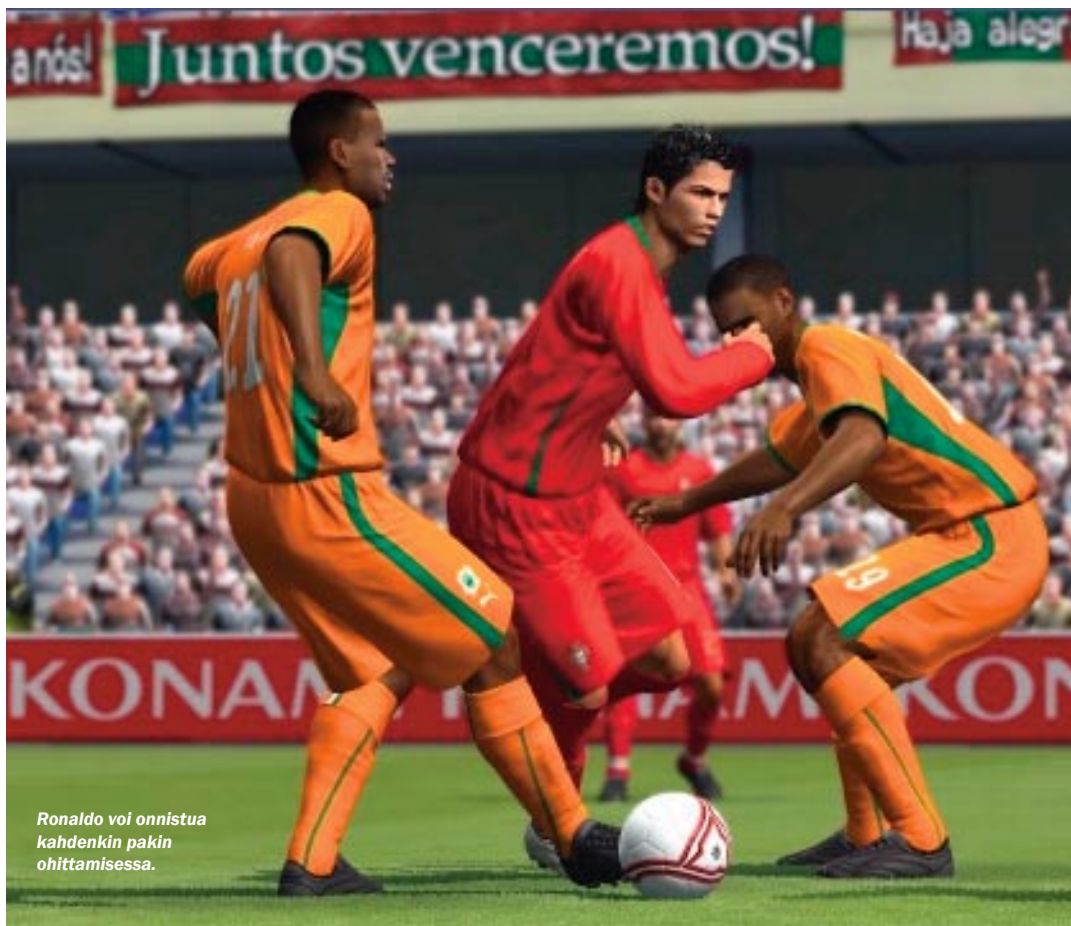
Ronaldo voi onnistua kahdenkin pakin ohittamisessa.

aina ratkaisevin tekijä. Puskutilanteissa pituus ja tuuri ratkaisevat voittajan, sijoittumisella tai oikea-aikaisuudella ei ole juuri merkitystä.